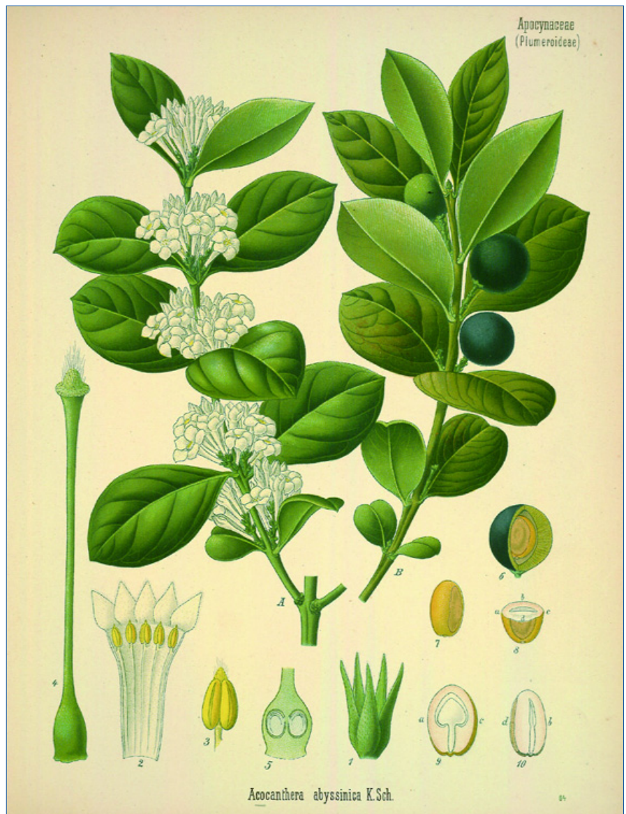
Abb. 2: Auch in der Pflanze Acocanthera ist das g-Strophanthin zu finden. Die ebenfalls gebräuchliche Bezeichnung OUABAIN leitet sich genauso von der Acocanthera-Pflanze ab, nämlich vom afrikanischen Ouabaio-Baum (Acocanthera ouabaio).

Prof. Manfred von Ardenne, einer der wohl genialsten Autodidakten unseres Jahrhunderts, überprüfte diese These durch Mikro-pH-Messungen am arbeitenden Herzen und fand, dass eine Anhäufung von Milchsäure und das Absinken des O 2 -Drucks unter 3,5 Torr in den unterversorgten Herzmuskelabschnitten den Atmungsstoffwechsel in Gärung umschlagen lassen. Dadurch nehme die Gärungs-Milchsäure noch mehr zu und führe an ungünstigen Stellen zu bis zu 1.000 kleinherdigen Nekrosen. Insbesondere im linken Ventrikel, der sich