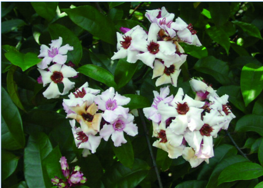
Abb. 1: Strophanthus gratus . Aus dieser Pflanze wird das herzwirksame Herzglykosid g-Strophanthin gewonnen.

Obwohl der Hauptwirkstoff des Samens des Schlingstrauchs Strophanthus fast ein Jahrhundert lang als das Mittel der Wahl bei Herzproblemen und zur Verhinderung des so genannten Herzinfarkts von der evidenzbasierten Schulmedizin geschätzt und flächendeckend eingesetzt wurde, fristet diese nach wie vor lebensrettende pflanzliche Substanz aus nur schwer nachvollziehbaren Gründen mittlerweile ein Nischendasein. Obwohl es mittlerweile sogar als körpereigenes Hormon entdeckt wurde. Dieser Artikel will über die Hintergründe, aber auch über die unverändert lebenserhaltende Relevanz des Strophanthins aufklären, insbesondere aber Mut machen, diese nach wie vor vorhandene Nische im Sinne der Erhaltung der eigenen Unversehrtheit und der Gesundheit Dritter couragiert zu nutzen und darüber hinaus zu erweitern.